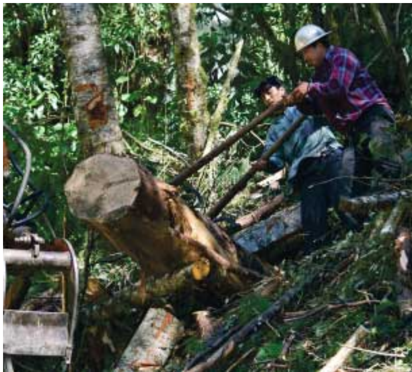
Det är tufft att arbeta med skogsavverkning i de tvärbranta skogarna. FSC-certifieringen innebär bland annat satsning på arbetarskydd.

underlaget för många av bergstrakternas småbönder rycktes undan och de tvingades flytta till Mexiko Citys kåkstäder.