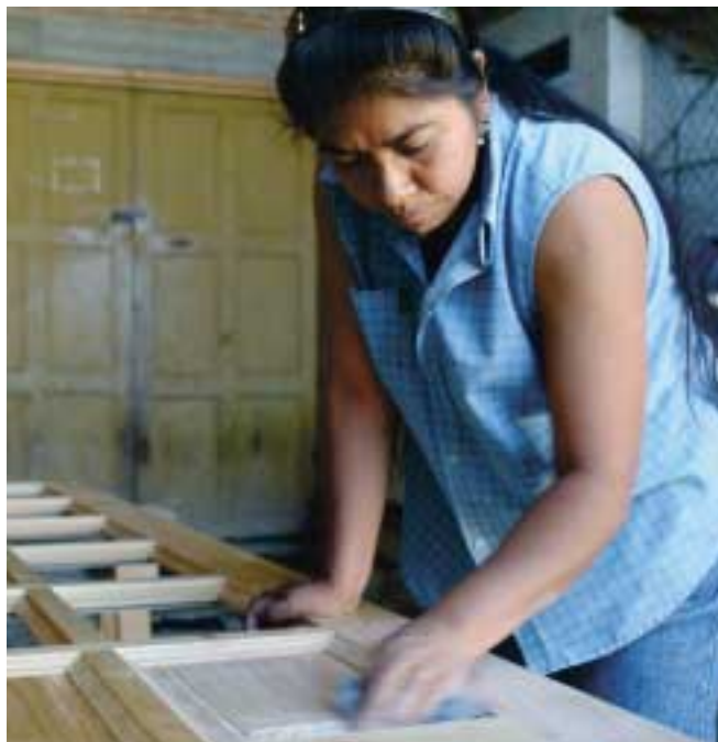
Ixtlán har sågverk, snickeri- och möbelfabrik. Alla varor som tillverkas är certifierade, men ännu har man inte nått ut på marknaden.

Resultatet av den hänsynslösa exploateringen blev förödande, inte bara för naturen med jorderosion och förstörda vattentillgångar. Socialt innebar rovdriften att försörjnings-